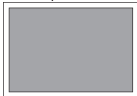
1/2 Seite hoch